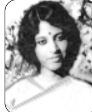
శ్రీమతి జయ.బి.ఎ. హైదరాబాద్.