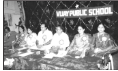
Guests on the dais